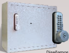
Diseñamos estructuras especiales para custodia de llaves