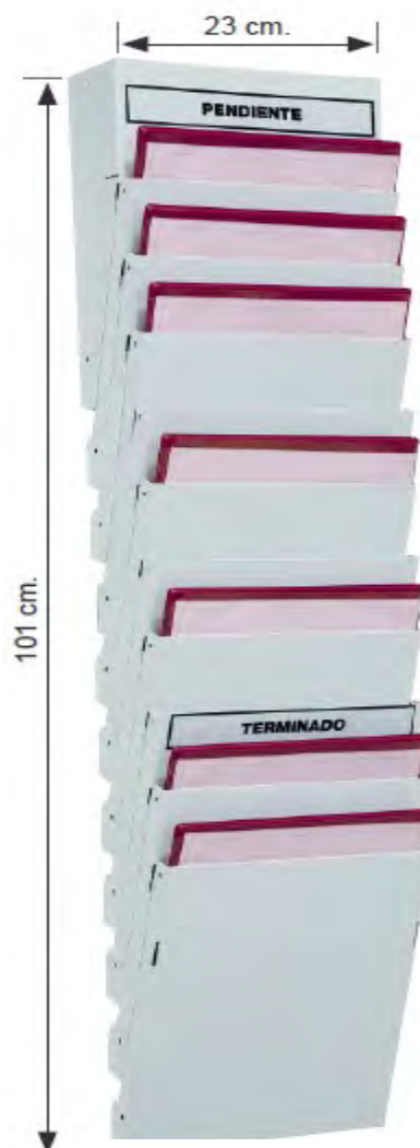
CARPETERO DE 10 BANDEJAS