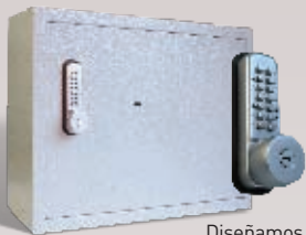
Diseñamos estructuras especiales para custodia de llaves